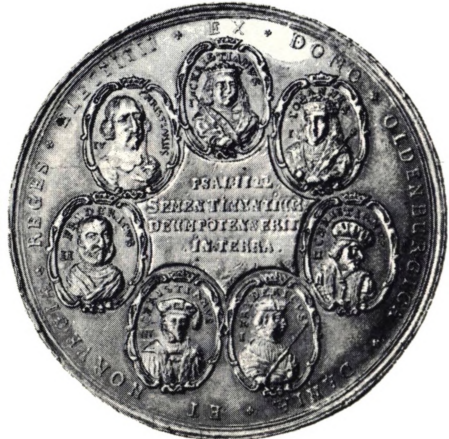
6153. U. A. Souverænitetemedaille i Guld. Av. Kongens Billed,